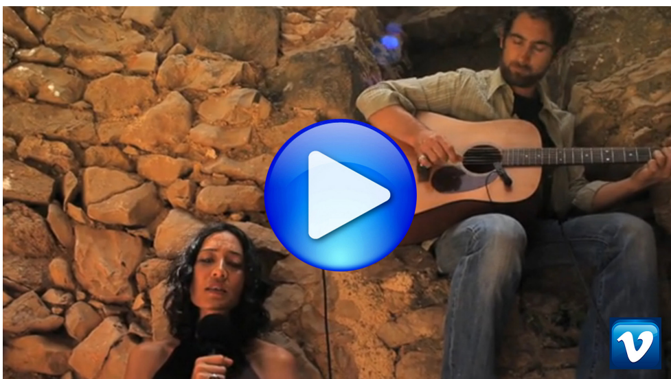
Figura 5. Enlace al vídeo en Vimeo sobre la canción “Colors” de SonLosGrillos.