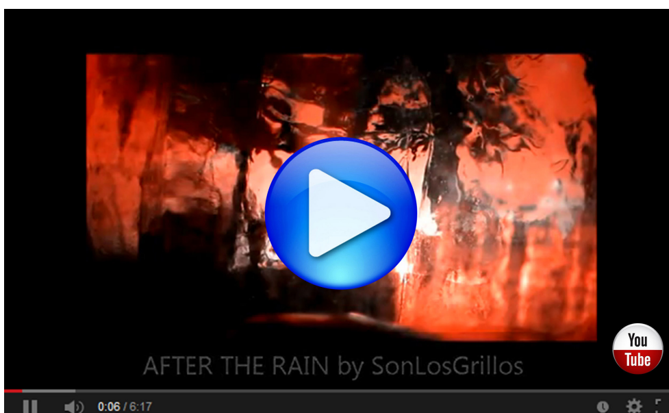
Figura 6. Enlace al vídeo en You Tube sobre la canción “After The Rain” de SonLosGrillos.