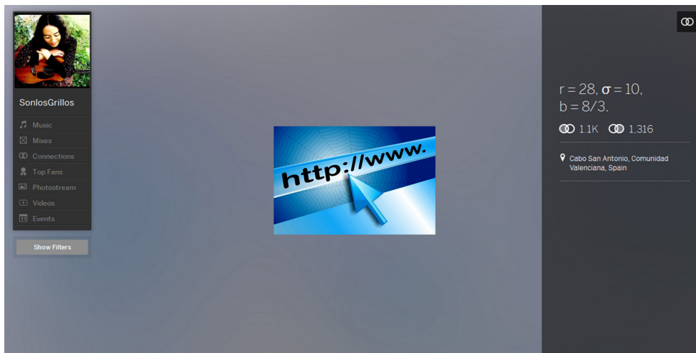
Figura 2. Enlace al Myspace de SonLosGrillos.