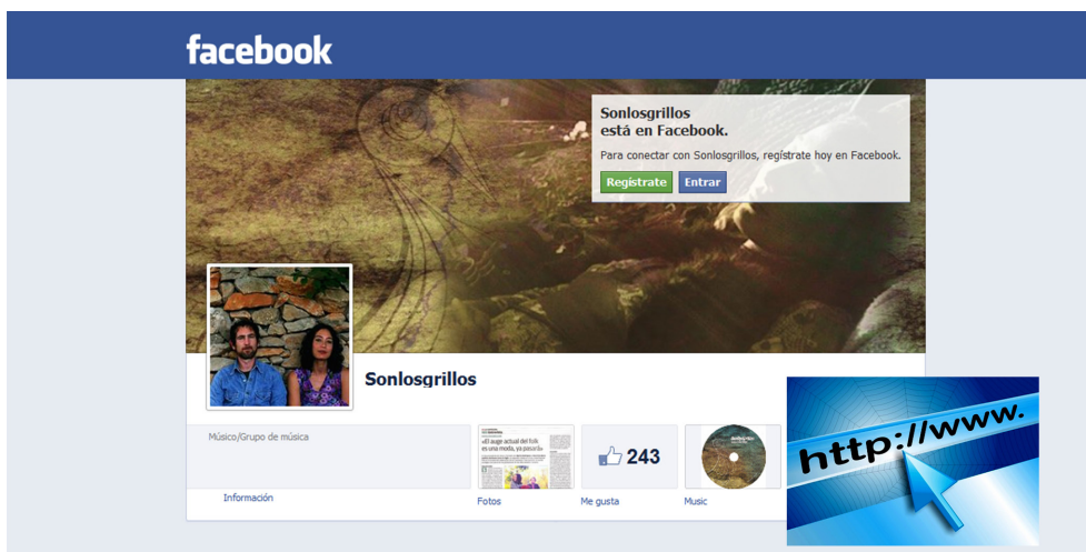
Figura 3. Enlace al Facebook de SonLosGrillos.